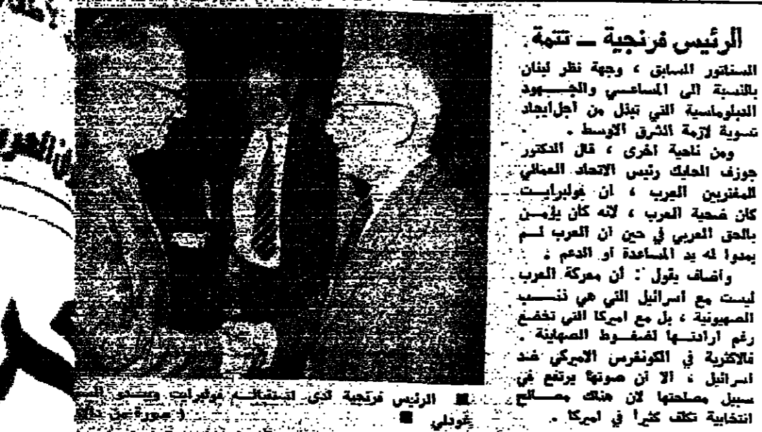
الرئيس فرجيه الذي استقبله بمرحبات حارّة في بيروت